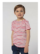
SOL'S MILES KIDS 01400