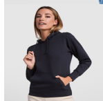
Duo Concept SU1068