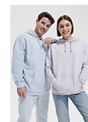
SOL'S CONDOR 03815