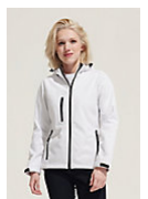
SOL'S REPLAY WOMEN 46802