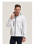
SOL'S REPLAY MEN 46602