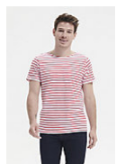
SOL'S MILES MEN 01398