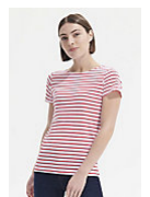
SOL'S MILES WOMEN 01399