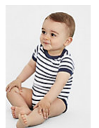
SOL'S MILES BABY 01401