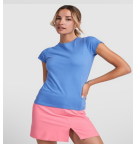
Duo Concept CA6683