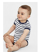
SOL'S MILES BABY 01401