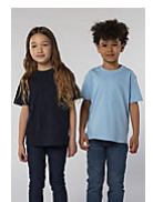
SOL'S Imperial KIDS 11770