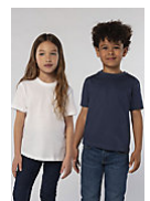
SOL'S REGENT KIDS 11970