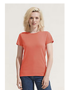
SOL'S CRUSADER WOMEN 03581