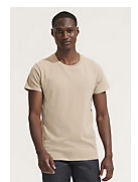
SOL'S CRUSADER MEN 03582