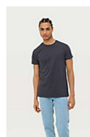
SOL'S PIONEER MEN 03565