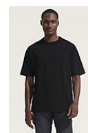
SOL'S BOXY MEN 03806